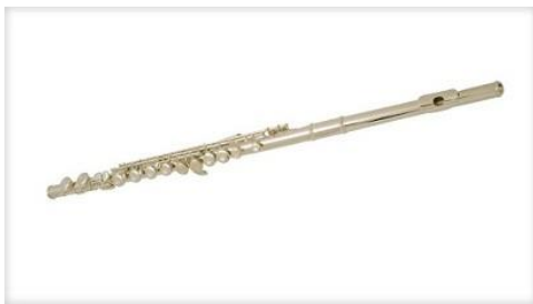
Na PREČNO FLAVTO igra flautist ali flautistka.

So tisti inštrumenti v katere pihamo, ko igramo nanje.