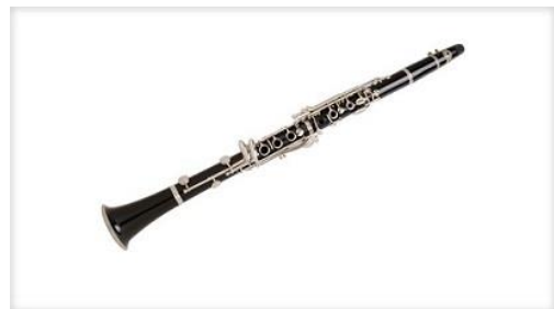
Na KLARINET igra klarinetist.