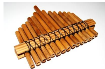
TRSTENKE – ljudsko glasbilo

Naša znana flautistka je Irena Grafenauer.